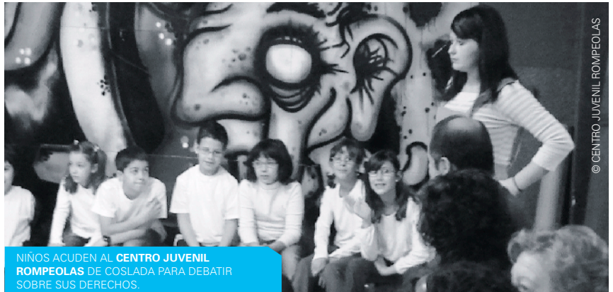
NIÑOS ACUDEN AL CENTRO JUVENIL ROMPEOLAS DE COSLADA PARA DEBATIR SOBRE SUS DERECHOS.

Los Ayuntamientos de Alcalá de Henares, Alcobendas, Alcorcón, Coslada, Getafe, Humanes de Madrid, Madrid, Móstoles, Pozuelo de Alarcón, Las Rozas, Rivas Vaciamadrid, Villalba